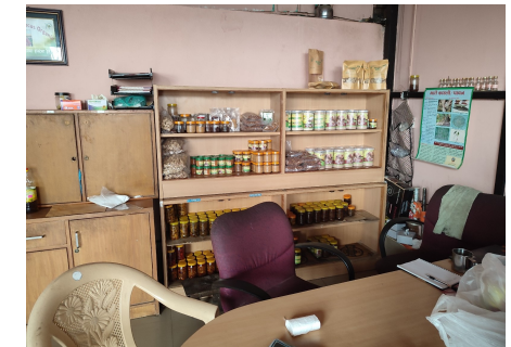
Commercialisation de produits agricoles locaux